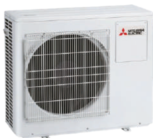
MXZ-2HA40VF / MXZ-2HA50VF